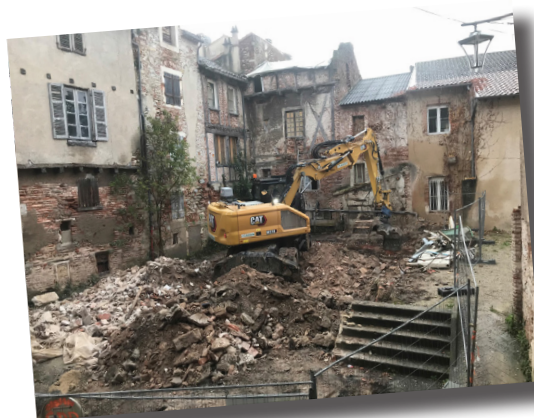
Chantier en cours, démolition d'une ancienne salle de danse